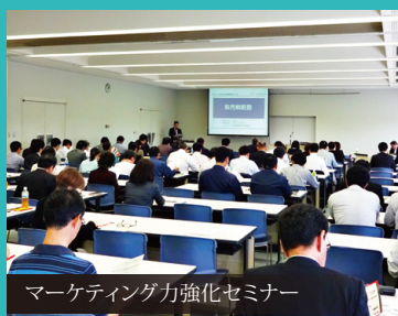
マーケティング力強化セミナー