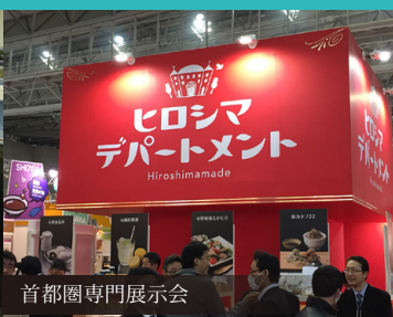
首都圏専門展示会