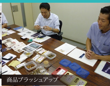
商品ブラッシュアップ